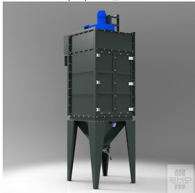
СРФ4К-ВЕНТ с бункером